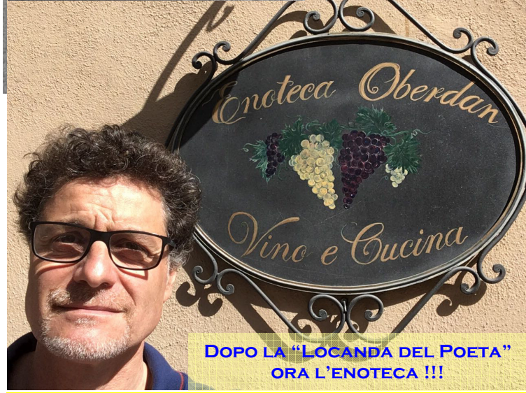
DOPO LA "LOCANDA DEL POETA" ORA L'ENOTECA !!!